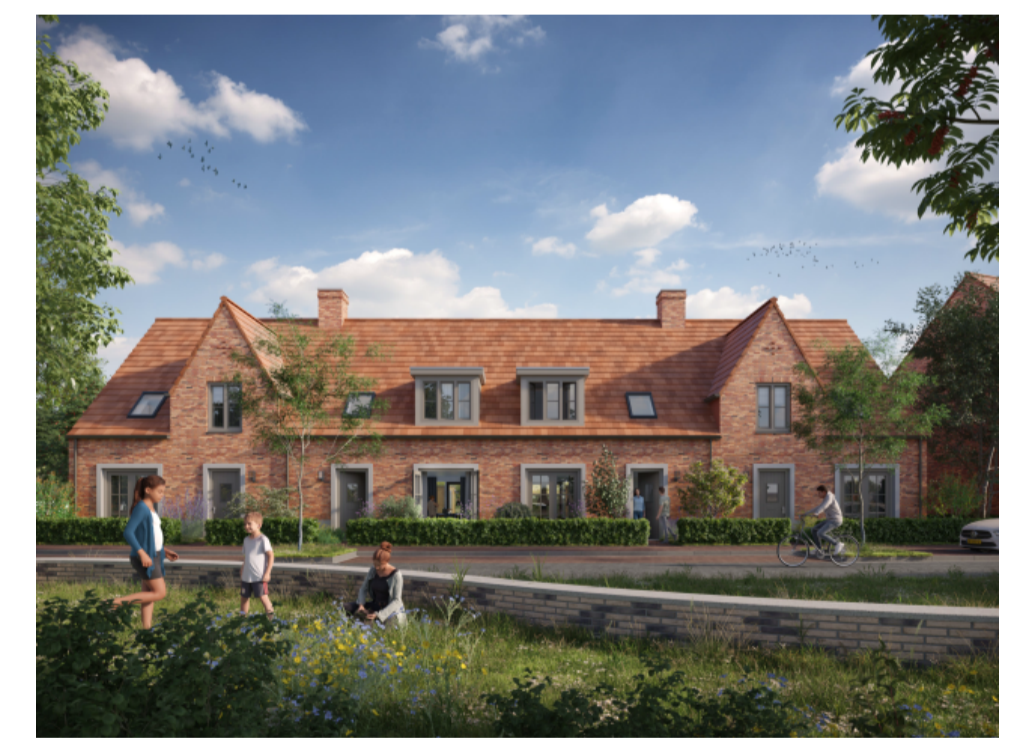
Rijwoning type "Fut" (F)